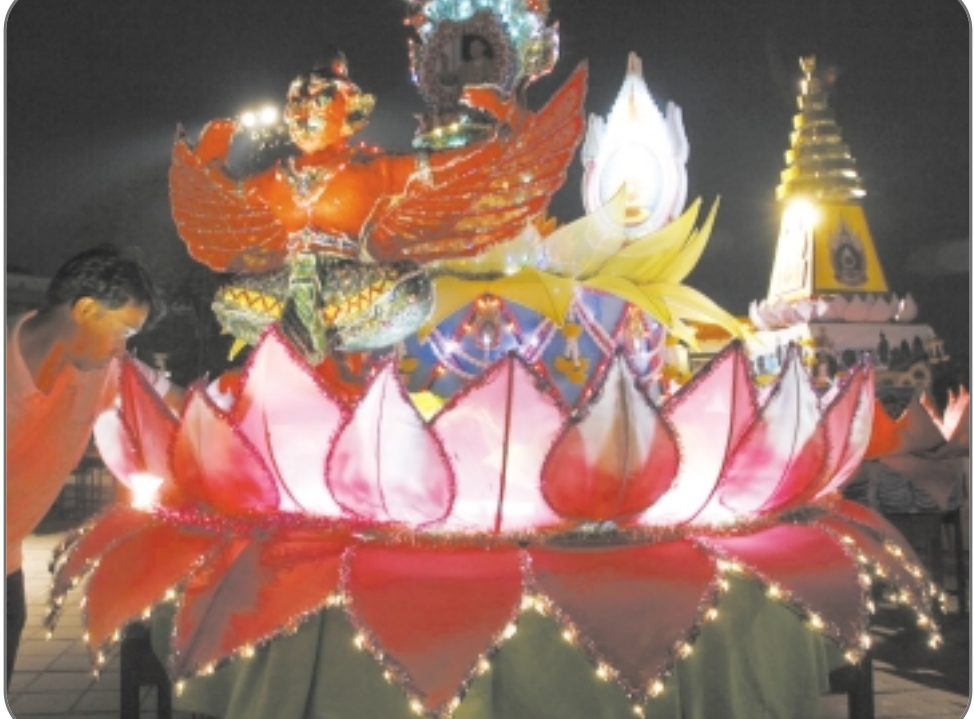
تاييلندي يعد قارباً مزخرفاً في مهرجان تقليدي سنوي في لوهيوري بتايلاند، تطلق فيه قوارب مزينة تعبيراً عن الطاعة لـ «إله الأنهار».

كما استخدمت مخرجة الفيلم قصة اخرى حديثة وقعت قبل اكثر من عامين، حيث قتلت احدي العائلات من قرية من قرى رام الله ابنتها بسبب اقامتها علاقة غرامية مع شاب من قرية اخرى. ويظهر الفيلم مشاهد حقيقية لبيوت مشتعلة، وذلك بعد ان مخلوطة بالميثانول.